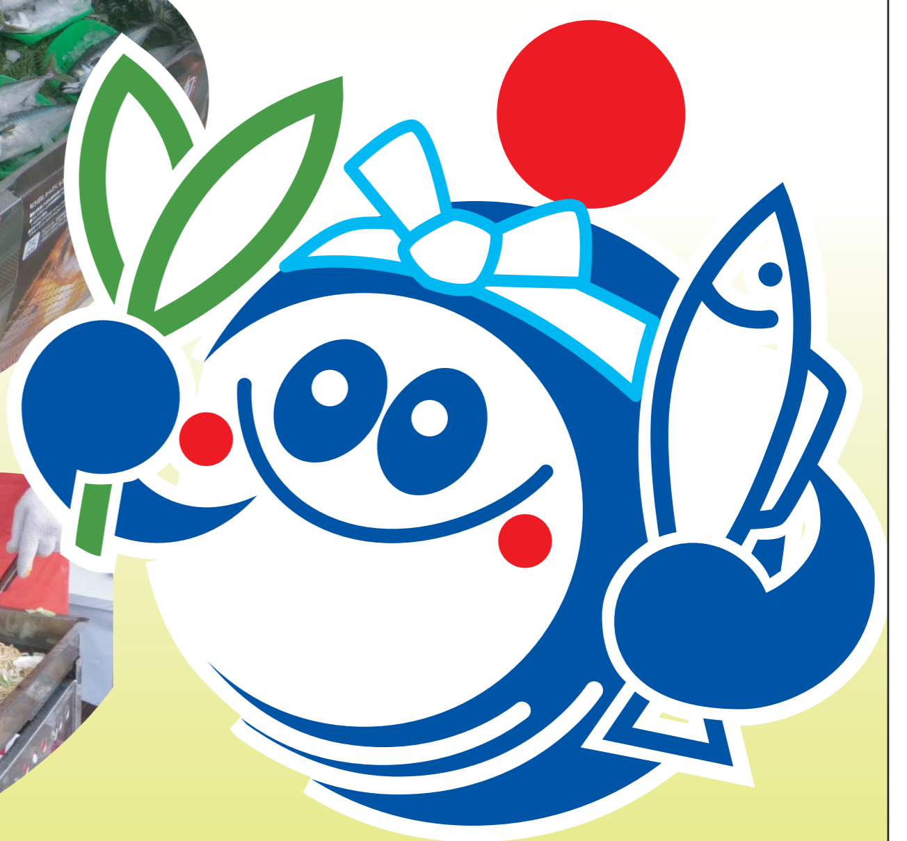
農林水産業・市場シンボルマーク“みのりん”

がんばろう日本!! このイベントの売り上げの一部は東日本大震災の義援金として寄付されます。 がんばろう農林水産まつり